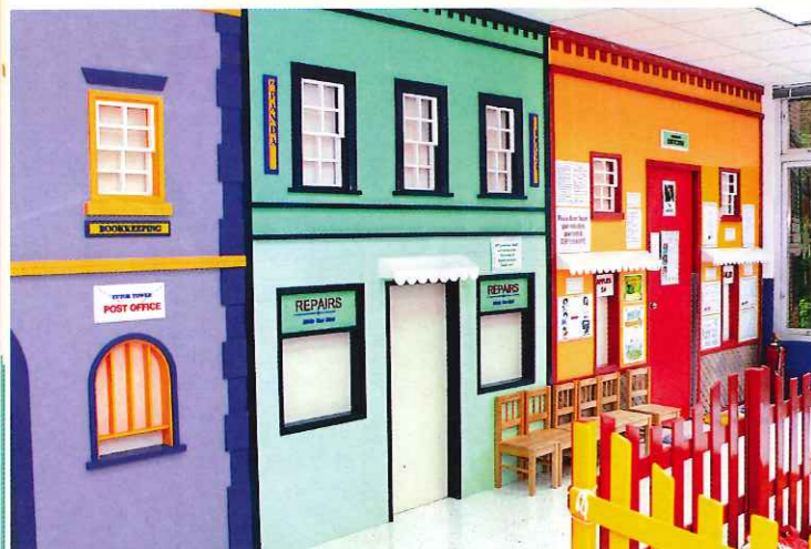
連課室門外也設計成街道一般，營造開心上課環境。