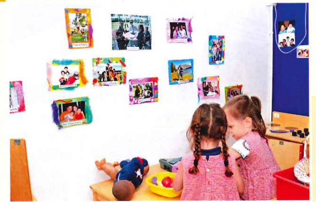
家家酒是職業扮演遊戲的一種，可以訓練對人關係和溝通能力。