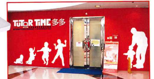
多多在香港共有5間分校，大潭紅山分校是最早創校的分校之一。

多多國際幼稚園是美國學前教育機構 Learning Care Group之附屬學校，現時多多在全世界各國，如美國、加拿大、葡萄牙、印尼、菲律賓等，設有超過500間分校。近年，香港家長對高質素幼兒教育的需求愈來愈高，有見及此，多多在2001先後創立了九龍塘多寶道，以及紅山半島分校。之後迅速發展，再開設北角寶馬山道、沙福道和半山堅道分校。