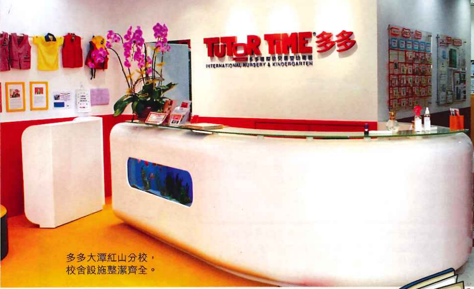
多多大潭紅山分校，校舍設施整潔齊全。

多多國際幼兒暨幼稚園是不少名人之選，袁詠儀囡囡魔童也曾就讀，學校參考美國專家的理論，制定雙語課程，並設有webcam系統，讓家長全天候監察孩子上課情況，子女學習開心、家長安心，怪不得獲得要求高家長的垂青。