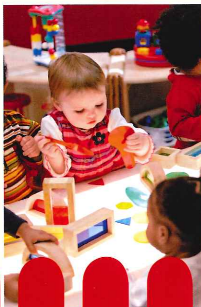
Playgroup以英文及普通話雙語上課，從幼兒開始練習語言及溝通。