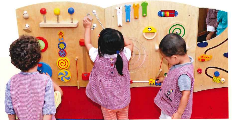
學校的玩具都是遵從教育專家的指引採購，適合該年齡的孩子遊玩。

Watson校長認為孩子的品格需從小培養，多多設有「Creating Character Program (培養品格課程)」，放棄填鴨式說教，以故事書每月介紹一種良好品格，如責任感、勇敢、創意、尊重、群體合作、善良、愛心等。故事中的主角會遇到道德的兩難處，如在公園拾到其他人的玩具，要怎麼辦？老師會引導小朋友討論，加入遊戲，讓小朋友思考、消化，把概念融於生活，達至全人發展的理念。