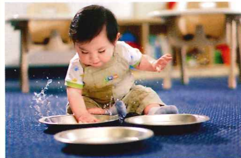
嬰幼兒活動組讓孩子動動手，自由探索，滿足好奇心。

多多的特別之處是入學年齡低，學校設了嬰幼兒的playgroup，同樣以英語和普通话授課，每節1.5小時，由6個月起便可參加。孩子可在上幼兒院前，開始習慣學校的環境。在課堂中，導師會以小組活動，帶領小朋友玩遊戲及進行親子活動，如歌謠、手偶遊戲等，除了幫助語言發展，更啟發想像力。